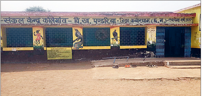
विभागीय अधिकारियों को इस ओर ध्यान देने तथा शासकीय पूर्व माध्यमिक शाला में जल्द से जल्द बाउंड्रीवॉल की मांग की गई ताकि स्कूल परिसर में आसामाजिक लोगों के जमावड़ा से राहत मिल सके।

शासकीय पूर्व माध्यमिक शाला कोलेगांव स्कूल परिसर में बाउंड्रीवॉल नहीं होने के कारण आसामाजिक तत्वों का जमावड़ा होने के कारण स्कूली छात्र छात्राओं के पढ़ाई लिखाई प्रभावित हो रही है। ग्रामीणों से मिली जानकारी के अनुसार शासकीय पूर्व माध्यमिक शाला कोलेगांव में बाउंड्रीवॉल के अभाव में स्कूल परिसर स्थित शौचालय व पानी टंकी तथा नल को छेड़छाड़ व तोड़फोड़ तथा आसामाजित लोगों द्वारा स्कूल परिसर में बैठकर शराब, गांजा व अन्य मादक पदार्थों का सेवन किया जा रहा है। जिससे स्कूली विद्यार्थियों को भारी दिक्कतों व परेशानियों का सामना करना पड़ रहा है। जिस पर ग्रामीणों व पालक गण ने जिम्मेदारों